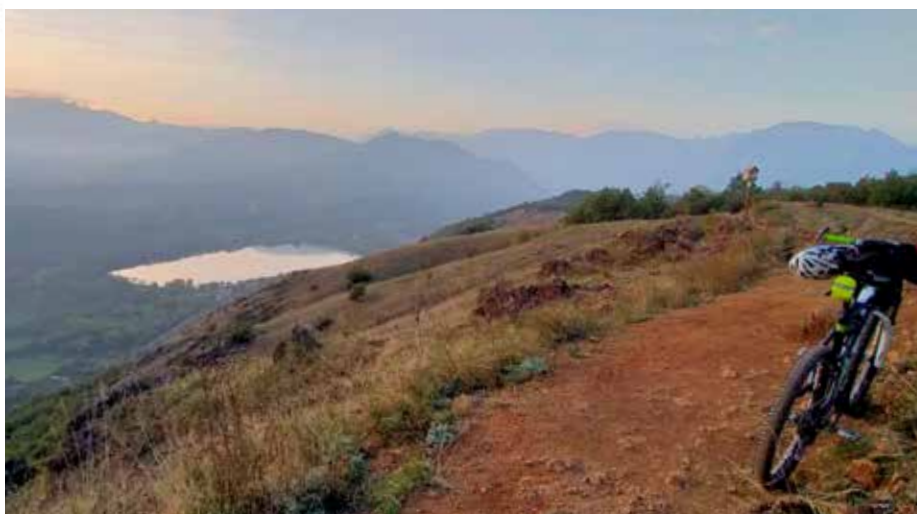
Vista dalla cima del Moncuni